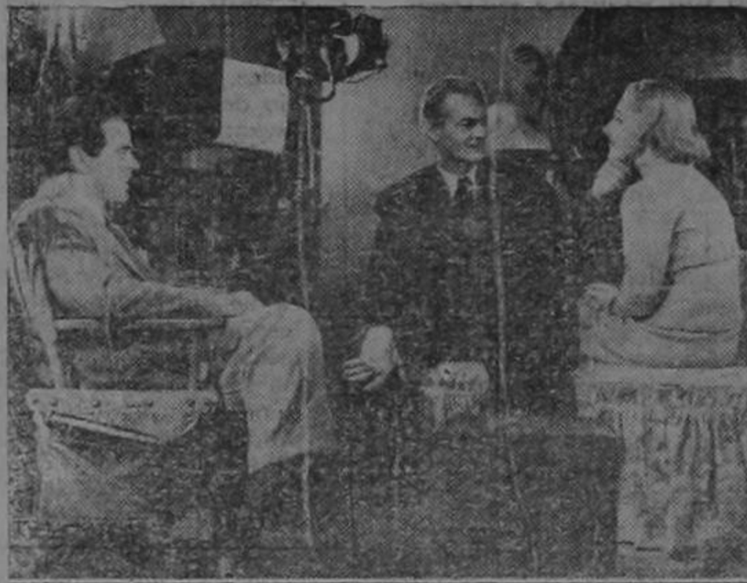
Edward Arnold y Mischa Auer son el centro de atracción en esta típica escena de la película dirigida por Frank Capra "Vive Como Quieras" que se estrenará muy pronto en nuestros cines. Los otros miembros del reparto que vemos en esta escena son: Dub Taylor, Ann Miller, James Stewart, Mary Forbes, Spring Byington, y Jean Arthur. Esta producción sin igual de la Columbia es una de las más maravillosas del mago de la dirección, Frank Capra.